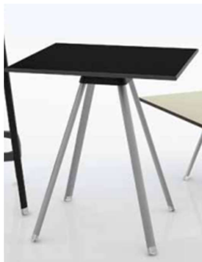
TAVOLO QUADRATO AREE RELAX 11/11