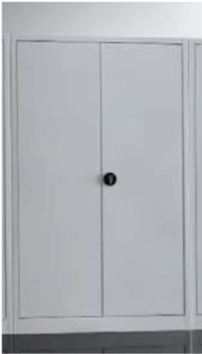
ARMADI METALLICI 100X60X200H 14/14