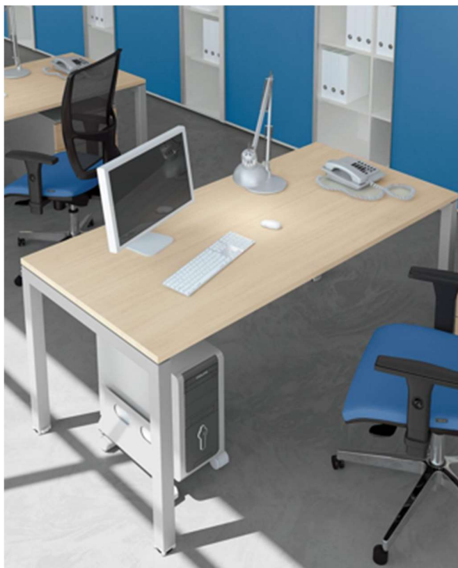
ESEMPIO TAVOLI STUDIO rif. 1/01 2/02 3/03