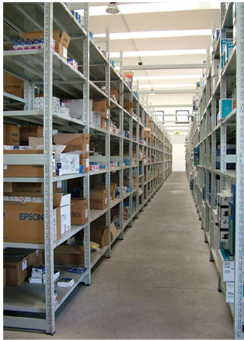
SCAFFALATURA METALLICA 15/15