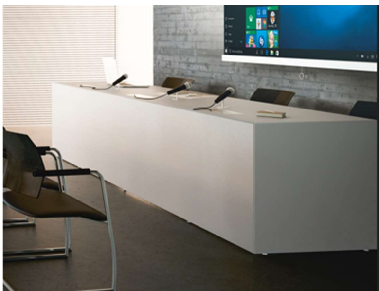
ESEMPIO CATTEDRA rif. 4/04