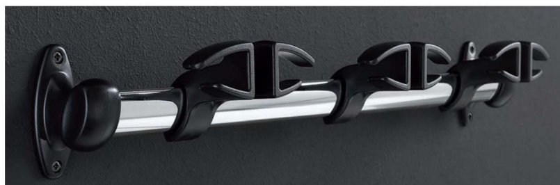
APPENDIABITI A COLONNA E A PARETE 12/12 13/13