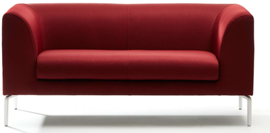
DIVANO 2 POSTI ATTESA E RELAX rif. 9/09