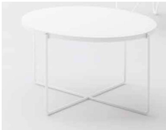
TAVOLO ROTONDO AREE RELAX 10/10