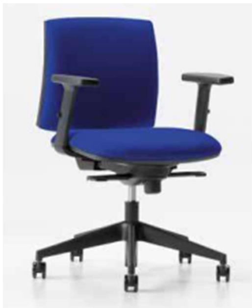
POLTRONA PER SALA CONFERENZA 5/05