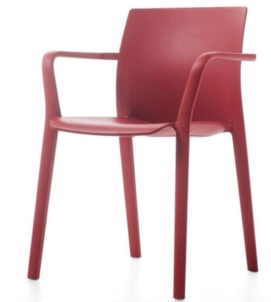
SEDIA AREA RELAX 7/07