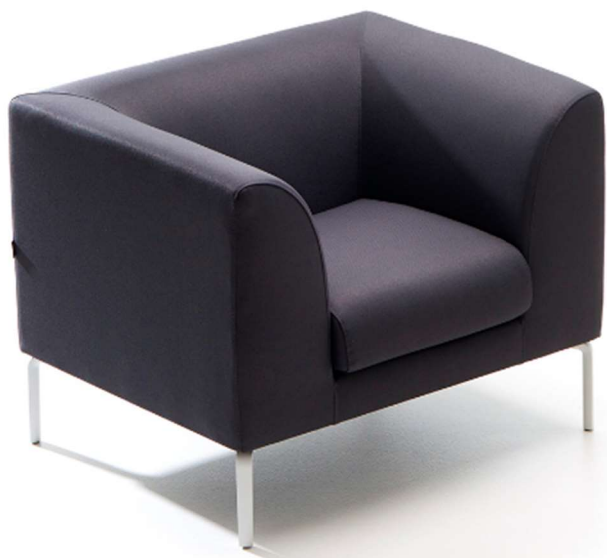
POLTRONA ATTESA E RELAX rif. 8/08